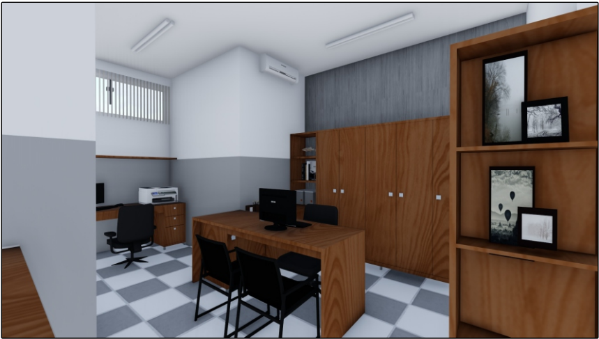
PERSPECTIVA 01 SEM ESCALA