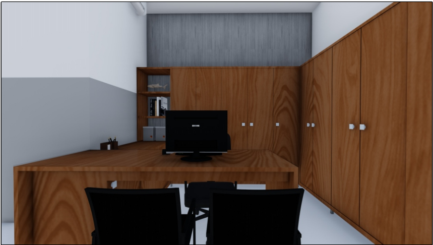
PERSPECTIVA 02 SEM ESCALA